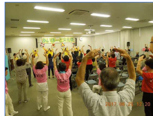
あいぽーと文化祭