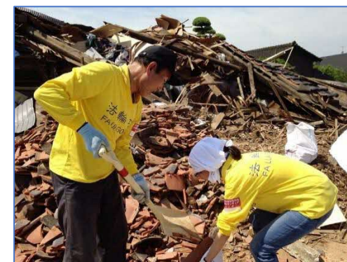
熊本地震救援活動