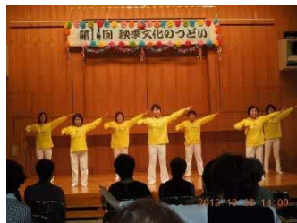
五福公民館文化祭