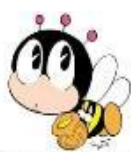
生涯学習マスコット マナビイ