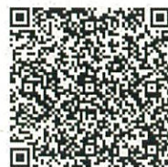
スマホ用 QR コード