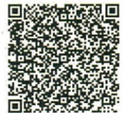
スマホ用 QR コード

C インターネット・南部公民館ホームページ ①「南部公民館」で検索⇒南部公民館のホームページに入ります。 ②「主催講座案内」の中から、希望する講座の「よろず申請本舗」をクリック⇒「よろず申請本舗」へ移動します。 ③利用規約に同意後、メールアドレスを記入し送信します。⇒「返信メール」が届きます。迷惑メール対策等を行っているためメールが届かない場合がありますので、設定を変更してください。 ④返信されてきたメールのリンクをクリックし、必要事項を記入のうえ、送信してください。 ⑤南部公民館で申込みが受理されると受理完了メールが届きます。⇒これで申込み完了です。 ⑥締め切り後3日以内に受講の可否に関するメールが南部公民館から届きます。