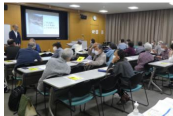
▲第2回の様子。意見が活発に交わされ、たくさんの情報が集まりました。それぞれのマイタイムライン作成の参考となる時間となりました。