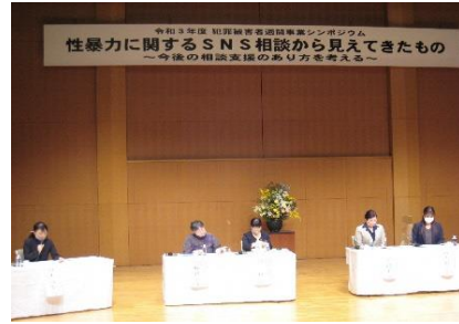
犯罪被害者週間事業（シンポジウム）の様子