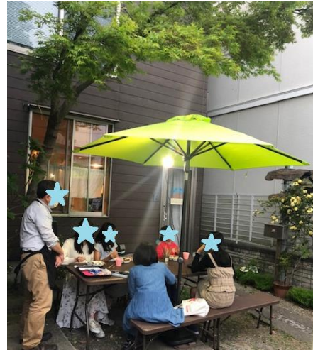
ある日の食事風景