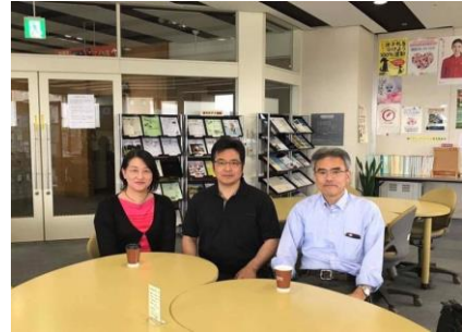
NPO法人RyuSunの メンバーです

空手道場『輝竜館』の運営を通じて、青少年育成とすべての年代が一緒に学ぶコミュニティの形成を図ります。3年毎に開催される宗家杯世界大会が楽しみです。