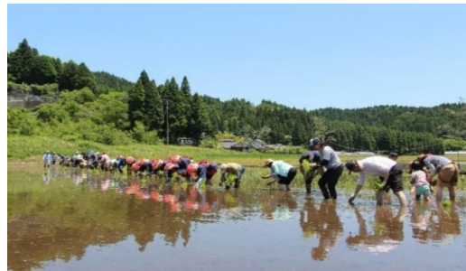
親子稲作体験 お田植え祭（阿蘇市・産山村）

みんなの富士山のネットワークを通じて、全国・全世界の被災地復興、防災（災害予防・対策）への啓蒙と、親子稲作体験で大地と触れ合うことにより、次の時代を担う青少年と都市生活者の心身の健全育成に寄与すること及び食の改善に向けて、大地と体に優しい食物の生産と流通の拡大のため、玄米粉料理ワークショップを開催し、農家と消費者との相互依存による支援と村おこしを目指し、それに伴う農業従事者の育成をすること、そして、ふるさと納税に参画することで、米農家の支援と青少年の健全育成への活動を進めることを目的としています。