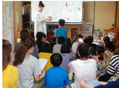
『地域食堂での親子（小学生）向け性教育の風景』