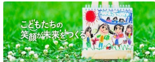
NEXTSTEPホームページロゴ

これからも、すべての子どもたちが笑顔で輝くことのできる地域社会を作っていけるよう、支援の幅を広げていきます。