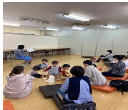
おはなしの世界を楽しむ親子

ペペペらんは、宇宙船の名前です。子どもたちをのせて、おはなしの世界へ飛び立ちます。