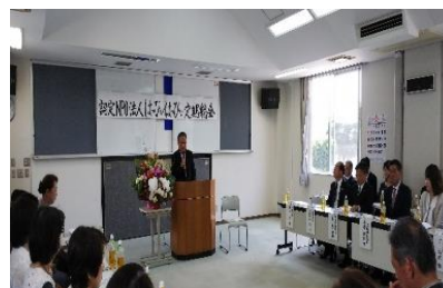
大津・菊陽町長、合志市長参列の総会の様子

幸せさがしに出会いの場を提供し、婚活の手助けを12年間にわたり活動。公益性が高い団体とする熊本県の認定NPO法人として、少子化対策及び高齢者福祉に一役。登録制により、婚活（若者、ミドル、シニア）パーティー、ファイル閲覧、紹介見合いを定期的に開催中。