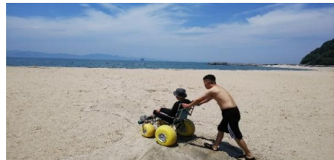
砂浜用車いす支援の様子

ご寄付頂いた資金は県内の様々な観光地のUD情報を取材、発信するために大切にに使わせていただきます。