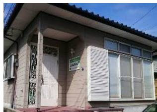
施設：エイムズ小山

当法人は、熊本市東区で重症心身障がい児を対象とした通所支援事業（児童発達支援事業・放課後等デイサービス事業）、また相談支援事業を展開しています。看護師による医療的ケア（服薬管理や体調管理等）や機能訓練担当職員によるハビリテーションを行い、生活面や余暇活動のサポートを行っています。特にスヌーズレンやコミュニケーションツールの活用に力を入れており、関係機関と連携を取りながら障がいのある方の社会参加を支援しています。