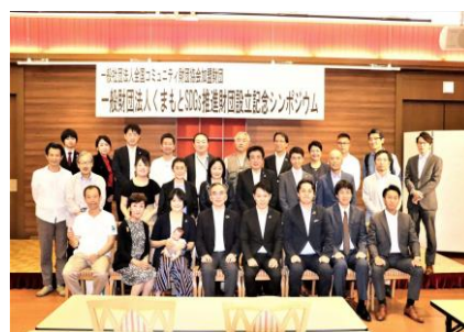
設立シンポジウムにて

地域の課題解決のための資金循環。そして、熊本に必要な、熊本らしいその仕組みづくりにご協力、ご賛同のほど何卒よろしくお願いいたします。