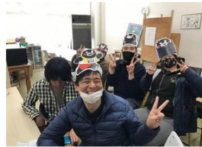
オンライン 全国大会 ズームで仲間交流会

又、次なるステップアップとしての就労までのプラットフォームの場として、企業・学校関係等の皆様と連携を図りながら、障がい者就労環境を整備していくことを目指しています。