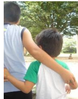
子どもたち ひとりひとりの 笑顔のために