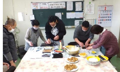
「恵方巻」作りの実習