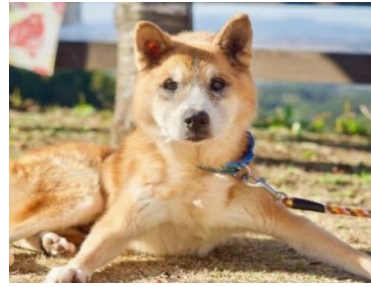
日向ぼっこ きずなの丘にて

より多くの方に私達の活動を知ってもらい、動物愛護について考えるきっかけとなってくれることを願います。