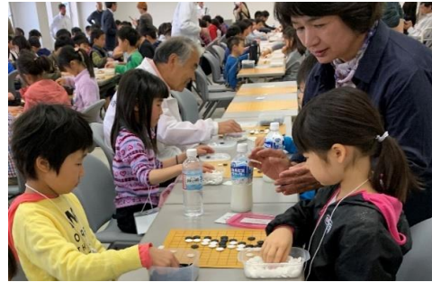
交流大会で対局を楽しむ子どもたち

皆様からいただいたご寄附は、県全体の子どもを集めた交流囲碁大会の開催や、幼稚園・地域公民館での囲碁教室への講師派遣、小学校の放課後児童クラブで囲碁を教える活動などに活用させていただきます。