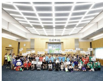
特別支援学校・学級、スペシャルオリンピックスの皆さん対象のポッチャ大会「楽球甲子園」に参加した皆さん

その他、障がい者及び障がい者の芸術やスポーツ活動を知っていただくために、フォーラムやトークショーを不定期に開催したり、芸術やスポーツ活動に取り組む団体の支援をしています。