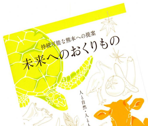
持続可能な熊本への提案 「未来へのおくりもの」（小冊子）の表紙です。 持続可能な未来への提案と実践を重ねていきましょう！