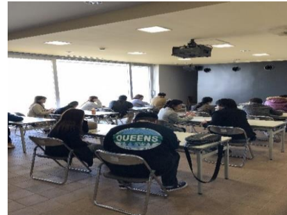
婚活セミナー風景

2015年に設立し地道に婚活セミナー、個人面談会、婚活パーティを開催し熊本県の少子化を少しでも止めるのと、県民の幸せを応援しようとスタッフ17名で頑張っております。 おかげで昨年度より現在交際をされているカップルは10組、結婚まで進んだカップルは4組になっております。いただいた寄附金は出会いのための個別相談サロン開設、更に充実した運営経費に活用したいと考えております。