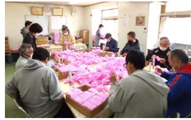
フルーツキャップの作業の様子