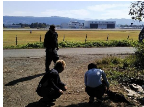
熊本空港の益城町側でのTNR活動中、40頭実施