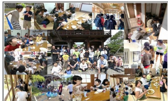
子どもたち支援活動の様子