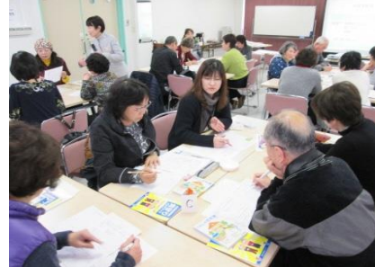
地域見守りサポーター養成講座 のグループワーク

現在、消費者の権利を確保するための支援活動として消費者相談、高齢者や若者を対象とした消費者教育講座の開催、調査活動、情報の提供などを行っています。行政、業界、消費者の連携の中で、「安全・安心な消費者の時代」を目指して、消費者団体としての社会的役割を果たすための努力を続けております。