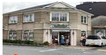
ひまわりパン店舗兼作業所

就労継続支援B型施設として、障がいのある人達とパンの製造販売を主な仕事としています。パンの製造販売のみならず、パンの製造に使用できる野菜やハーブ類を、自家農園で地域の農家の方々の協力を得て、育成し収穫しています。