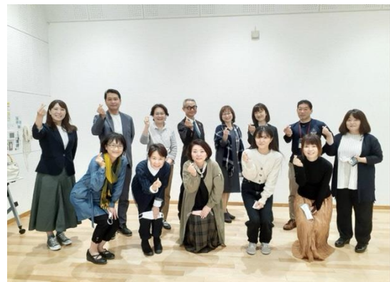
☆B4S熊本 子ども若者応援団☆ スタッフ＆ボランティア大募集！

これからも社会的養護下の子どもたちにより良い支援を行うため、それぞれの特長・専門性を持つ社会資源にも積極的に橋渡し（ブリッジ）し、子どもたちがどんな環境で生まれ育っても、夢と希望を持って笑顔（スマイル）で暮らせる社会を目指して活動してまいります。