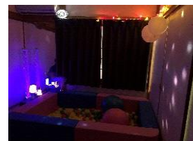
部屋の様子 スヌーズレン