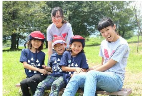
YMCAのユースリーダーと子どもたち

熊本YMCAは戦後間もない1948年（昭和23年）に誕生。「共に生きる社会」「地球環境の保全」「生涯学習の推進」「ウエルネス活動」「ボランティア活動」「平和な世界」を使命に掲げて働きを行っています。スポーツスクール、野外活動、フィットネス、語学教室など、幼児からシニアの広い世代に向けたプログラムを展開するほか、災害支援やユースリーダー育成、国際協力にも取り組んでいます。