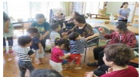
「地域の縁がわ」での交流の様子

熊本地震、豪雨災害で減少していく地域の縁がわの再生のため、県内580か所の縁がわの拠点づくりにも力を入れ取り組んでいます。