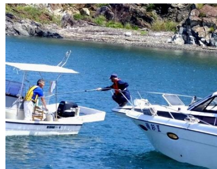
安全啓発パンフレット配布の様子

隊員は、小型船舶免許はもとより、海上安全指導員、看護師、海上特殊無線技士、アマチュア無線技士、工事作業の警戒船業務・管理講習受講者、スクーバー、潜水士等の資格保有者が多数在籍し、日々研鑽しています。