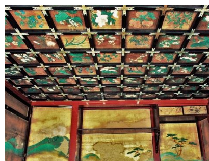
波奈之丸(なみなしまる)内部・天井画

ふるさとを想う皆さまのご支援を、後世に繋がる新たな文化財として、また、熊本城天守閣の復旧にも花を添えられるような展覧会を実現させたいと願っています。どうぞ宜しく願いいたします。