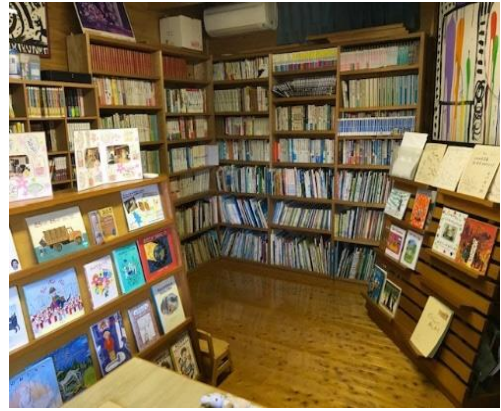
「びわの木文庫」 研究会事務所2階に併設