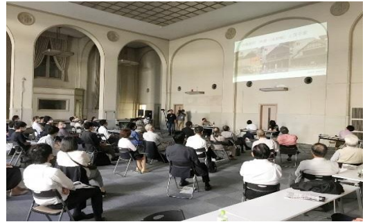
熊本の未来を語る 歴史まちづくりフォーラム 2020年10月10日 カーリーノMSビル (旧住友銀行熊本支店社屋／昭和9年建造)