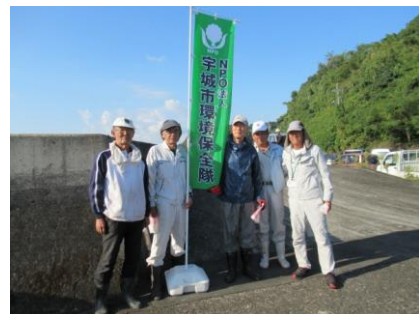
不知火海岸清掃活動の様子

まず、耕作放棄地や休耕田にヒマワリの種や菜の花の種をまき、地球温暖化の原因である二酸化炭素を吸収させ温暖化防止活動を展開します。そして、ゴミのないきれいな宇城市にすることを目標に一生懸命に取り組んでまいります。