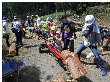
薪割り体験イベントの様子

頂いた寄附は、薪生産や草原環境学習に必要な備品の購入やイベント等の運営費用に使わせて頂きます。