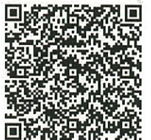
スマホ用 QR コード

※ 受講中の写真を熊本市の広報活動に利用させていただく場合があります。 気になられる方は、遠慮なく職員までお申し出ください。 ※ 受講に際し、公民館で配慮が必要な場合は、遠慮なくご相談ください。