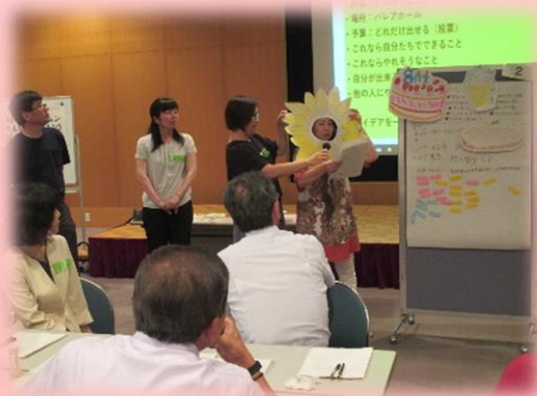
【みんなの前で企画のプレゼン】