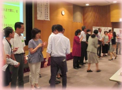
【バースデーチェーン】