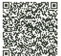
スマホ用 QR コード

※ 受講中の写真を熊本市の広報活動に利用させていただく場合があります。 気になられる方は、遠慮なく職員までお申し出ください。 ※ 受講に際し、公民館で配慮が必要な場合は、遠慮なくご相談ください。