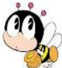
生涯学習マスコット マナビイ